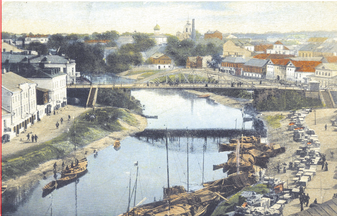
Псков. Река Пскова, рыбный ряд. Время создания: начало XX века. Фотограф неизвестен. Собрание открыток ЦАК. Издание акционерного общества «Гранберг» в Стокгольме.

Присылайте в нашу редакцию интересные фотографии любимого города!