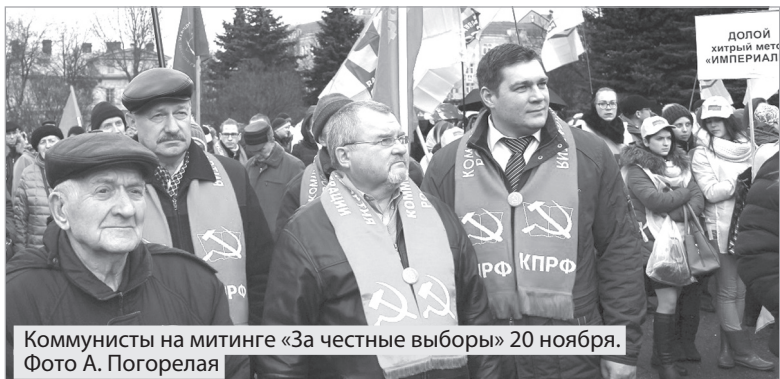
Коммунисты на митинге «За честные выборы» 20 ноября.