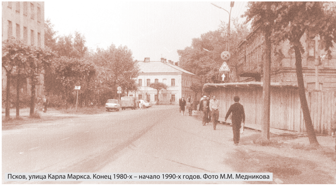
Псков, улица Карла Маркса. Конец 1980-х – начало 1990-х годов.

Присылайте в нашу редакцию интересные фотографии любимого города!