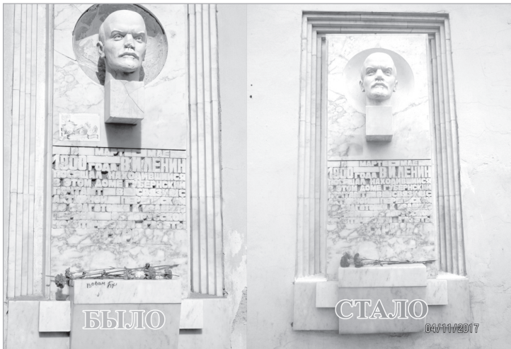
Горельеф Ленина на Советской до и после реставрации

делав большую работу по созданию марксистской газеты «Искра» и журнала «Заря».