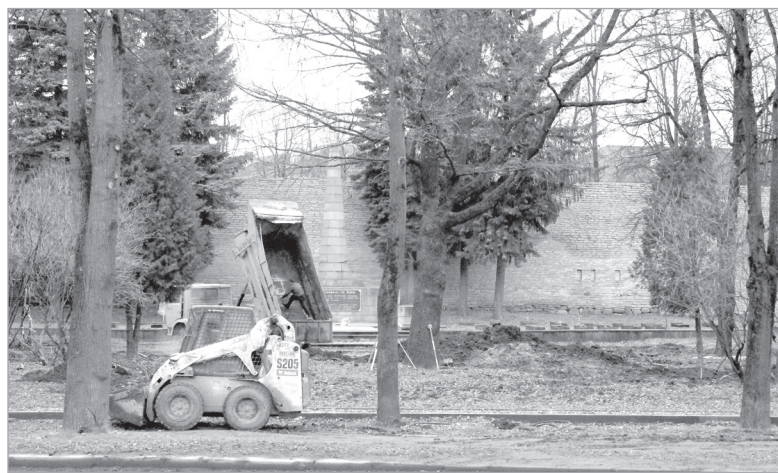
Реконструкция и благоустройство сквера Павших борцов