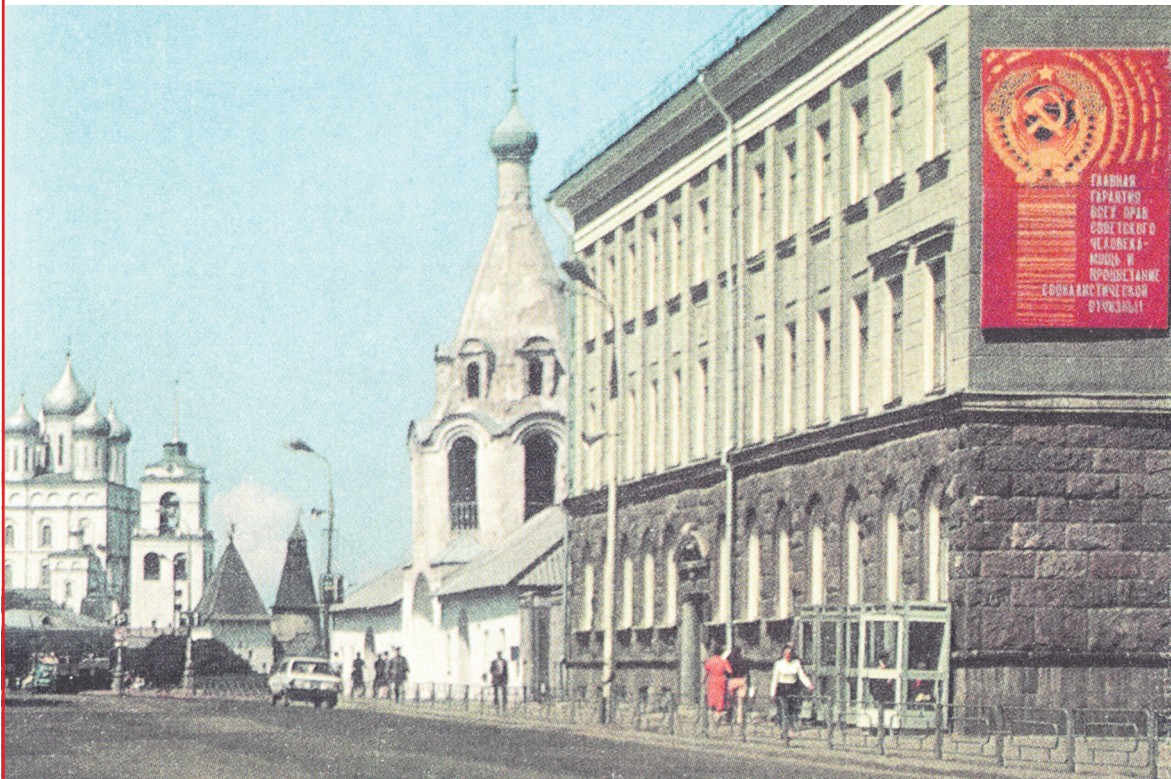
Псков, ул. Советская 1980–1982 гг.

Присылайте в нашу редакцию интересные фотографии любимого города!