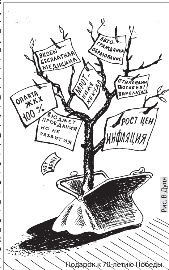
Подарок к 70-летию Победы