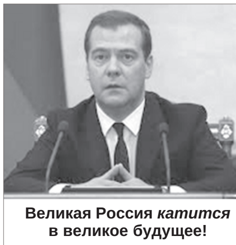
Великая Россия катится в великое будущее!

Подписать за отставку правительства Медведева можно здесь: http://www.opentown.org/news/20362/