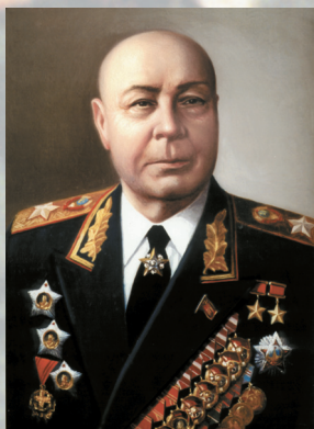
Маршал Советского Союза ТИМОШЕНКО С. К.