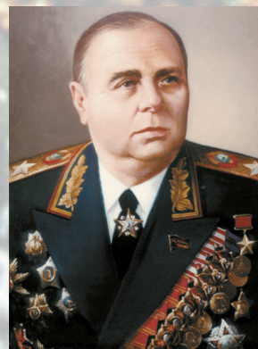
Маршал Советского Союза МЕРЕЦКОВ К. А.