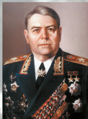
Маршал Советского Союза ВАСИЛЕВСКИЙ А. М.