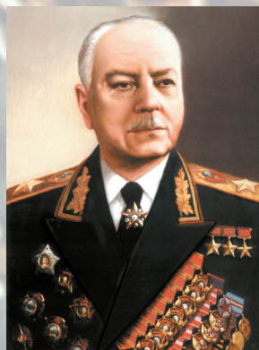
Маршал Советского Союза ВОРОШИЛОВ К. Е.