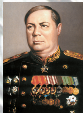
Маршал Советского Союза ТОЛБУХИН Ф. И.