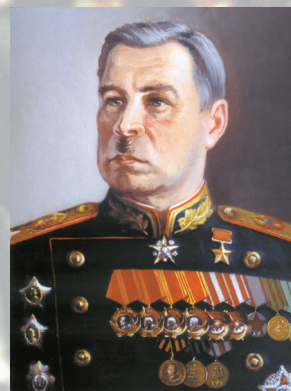
Маршал Советского Союза ГОВОРОВ Л. А.