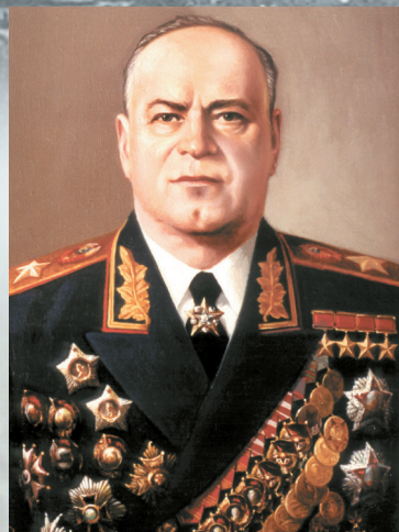
Заместитель Верховного Главного командующего Маршал Советского Союза ЖУКОВ Г. К.