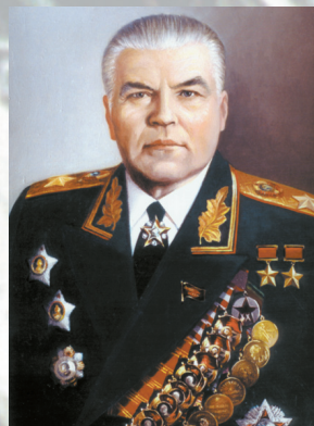
Маршал Советского Союза МАЛИНОВСКИЙ Р. Я.