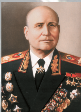
Маршал Советского Союза КОНЕВ И. С.