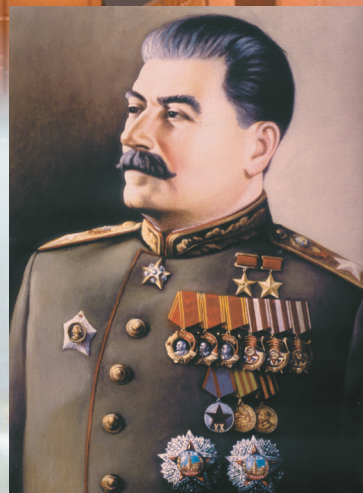
Верховный Главнокомандующий Генералиссимус Советского Союза СТАЛИН И. В.