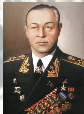
Адмирал Флота Советского Союза КУЗНЕЦОВ Н. Г.