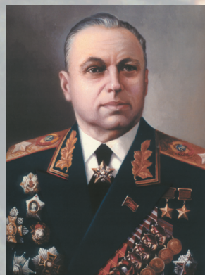
Маршал Советского Союза РОКОССОВСКИЙ К. К.