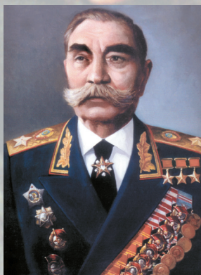
Маршал Советского Союза БУДЁННЫЙ С. М.