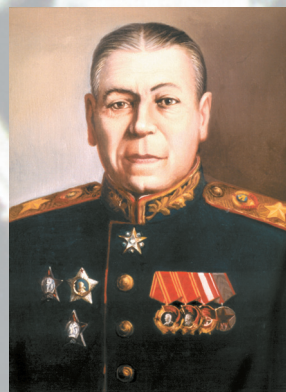
Маршал Советского Союза ШАПОШНИКОВ Б. М.