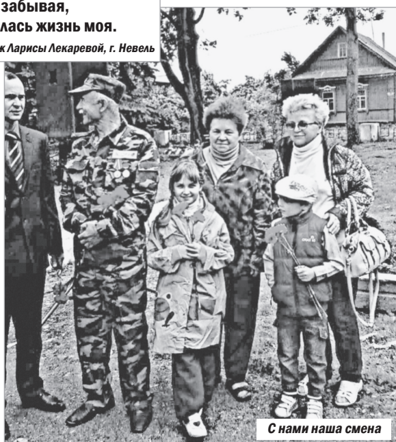
С нами наша смена