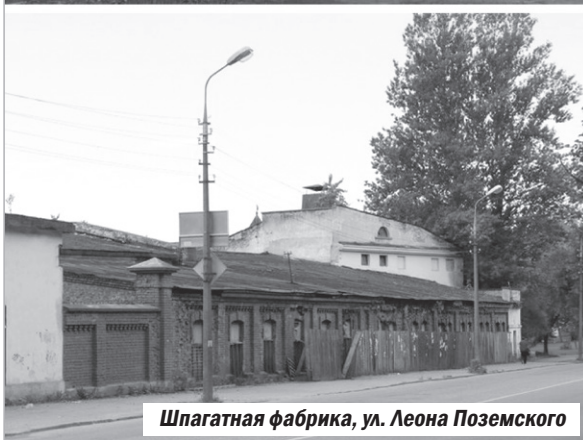
Шпагатная фабрика, ул. Леона Поземского