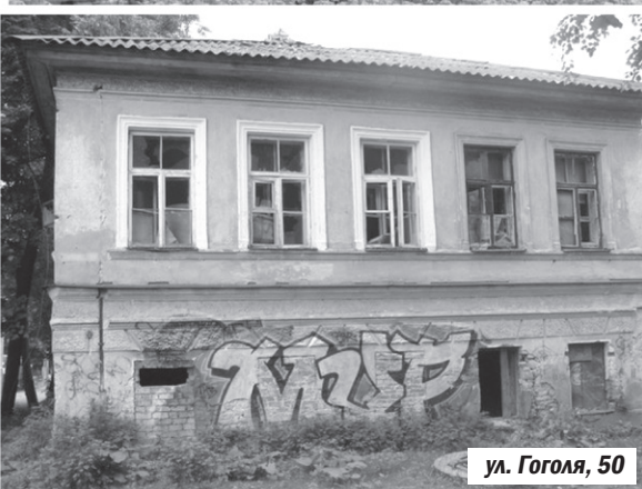
ул. Гоголя, 50

А сегодня вновь остро встал вопрос будущего территории бывшего областного психоневрологического диспансера, прилегающей к охранным зонам Покровской башни. Предполагается здание бывшего диспансера реконструировать под гостиницу с созданием всех сопутствующих объектов — автостоянки, ресторана и т.п., чего нельзя допустить, не нарушив при этом целостности Псковского исторического комплекса.