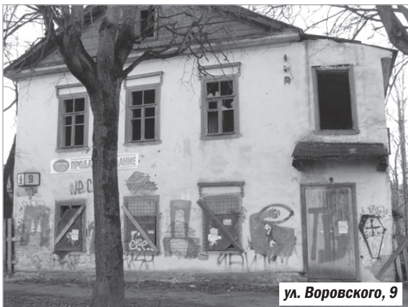
ул. Воровского, 9

В начале 2014 года Сообществом защитников памятников Пскова было проведено анонимное голосование по выборам самого недостойного гражданина Пскова 2013 года . По итогам голосования — «Кто по Вашему должен быть изгнан с позором из вольного города Пскова?» со значительным отрывом от остальных претендентов сомнительную победу одержал губернатор Турчак и стал, таким образом, самым недостойным гражданином Пскова ( http://vk.com/wall-23391841_1904 ). За изгнание Турчака из вольного города Пскова высказались 50,2% голосовавших горожан. И есть за что: