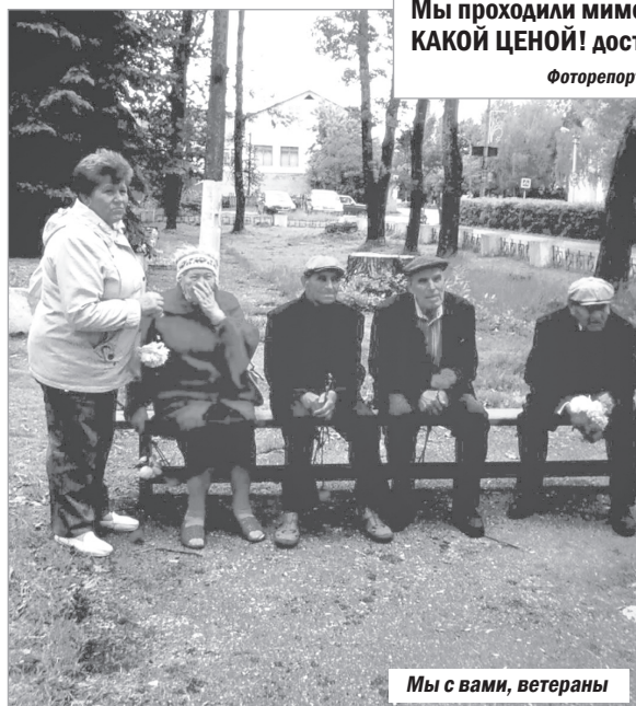
Мы с вами, ветераны