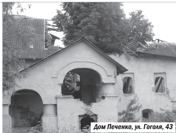
Дом Печенко, ул. Гоголя, 43