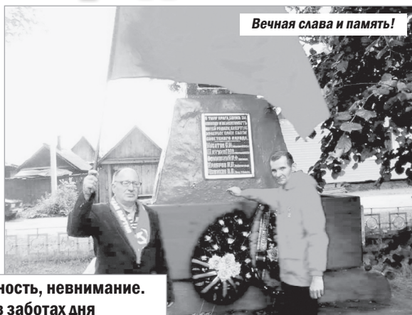
Вечная слава и память!

Простите нас за хладность, невнимание. Простите, что порой в заботах дня Мы проходили мимо, забывая, КАКОЙ ЦЕНОЙ! досталась жизнь моя.