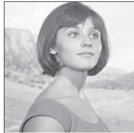
Кадр из фильма «Кавказская пленница»

Парламентарии считают, что законопроект не допускает присвоение каким-либо лицом исключительных прав на такие произведения и не допускает приватизации советского общенародного культурного наследия. Поправки предлагается ввести в действие уже с 1 января 2015 года.