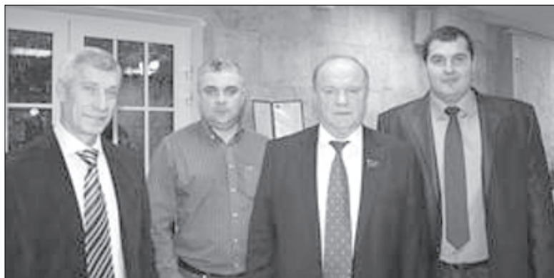
Делегаты съезда от Псковской области с руководителем КПРФ Г. Зюгановым

Форум открылся исполнением Гимна Советского Союза. С приветственным словом к его участникам обратился Председатель ЦК КПРФ Г. Зюганов.