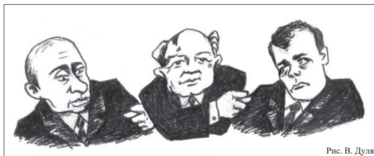
Рис. В. Дуля

Оставим в стороне саму мысль о возможности «второго пришествия» Горбачева в большую политику, но, как говорится, «сказка – ложь, да в ней намек». Уже тот факт, что даже такая ничтожная фигура призывает Путина и Медведева вче-