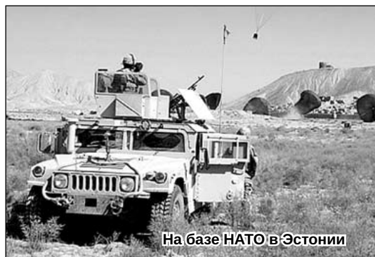
На базе НАТО в Эстонии

На этом фоне предательски выглядят сокращения в российской армии. Только в Псковской области ликвидированы базы РВСН в п. Сосновый Бор в Себежском районе и на ее месте построен лагерь для заключенных. На базе ракетных комплексов С-20 в Палкинском районе шахты используются как холодильники. Ликвидированы дивизия дальней авиации в Гдовском районе и радиолокационная станция ПВО по низко летящим целям в Стругокрасненском районе, которая первой перехватила самолет Руста, нарушившего го-