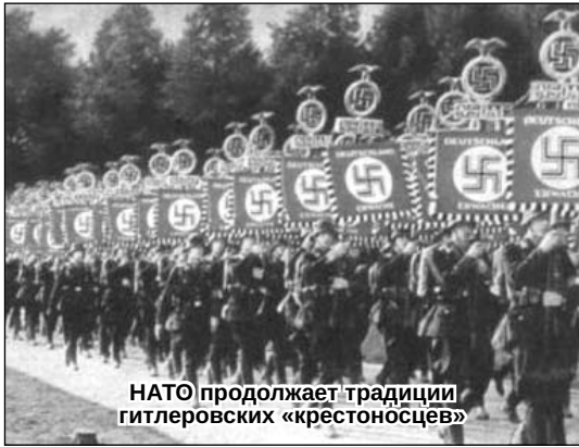
НАТО продолжает традиции гитлеровских «крестовосцев»

Операция по патрулированию воздушного пространства, осуществляемая НАТО в Эстонии,